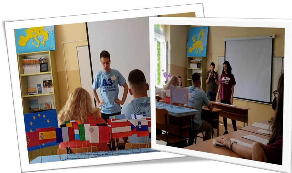
Фигура 9. Дебат на тема „Brexit”

След успешната работа на посланиците през юни 2018 г. ПЕГ „Никола Йонков Вапцаров” беше акредитирано като „Училище посланик на Европейския парламент” и към момента е единственото училище посланик в област Шумен.