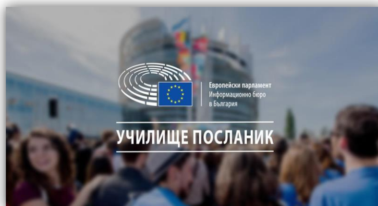
Фигура 1. Лого на програмата за училища посланици на Европейския парламент

За целта Европейският съюз предлага проекти и програми за сътрудничество в областта на образованието и обучението на младите хора. Такива проекти и програми са „Еразъм +“, „Жан Моне“, „Програма за училища посланици на европейския парламент“ и др.