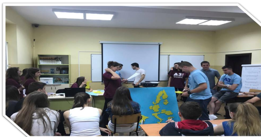
Фигура 5. Игра – пъзел „Познай държавата и я постави където се намира на картата“

- игра – пъзел „Познай държавата и я постави където се намира на картата“ (Фиг. 5);