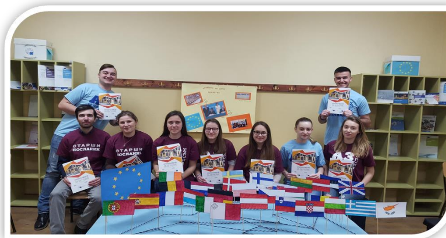
Фигура 3. Част от участниците

В началото на учебната 2017/2018 година за работа по „Програмата за училища посланици на Европейския парламент“ кандидатстваха 100 училища от различни градове в България. След разглеждане на кандидатурите бяха избрани 30 от тях, които да участват в нея. Сред одобрените училища беше и ПЕГ „Никола Йонков Вапцаров“ град Шумен (Фиг. 3).