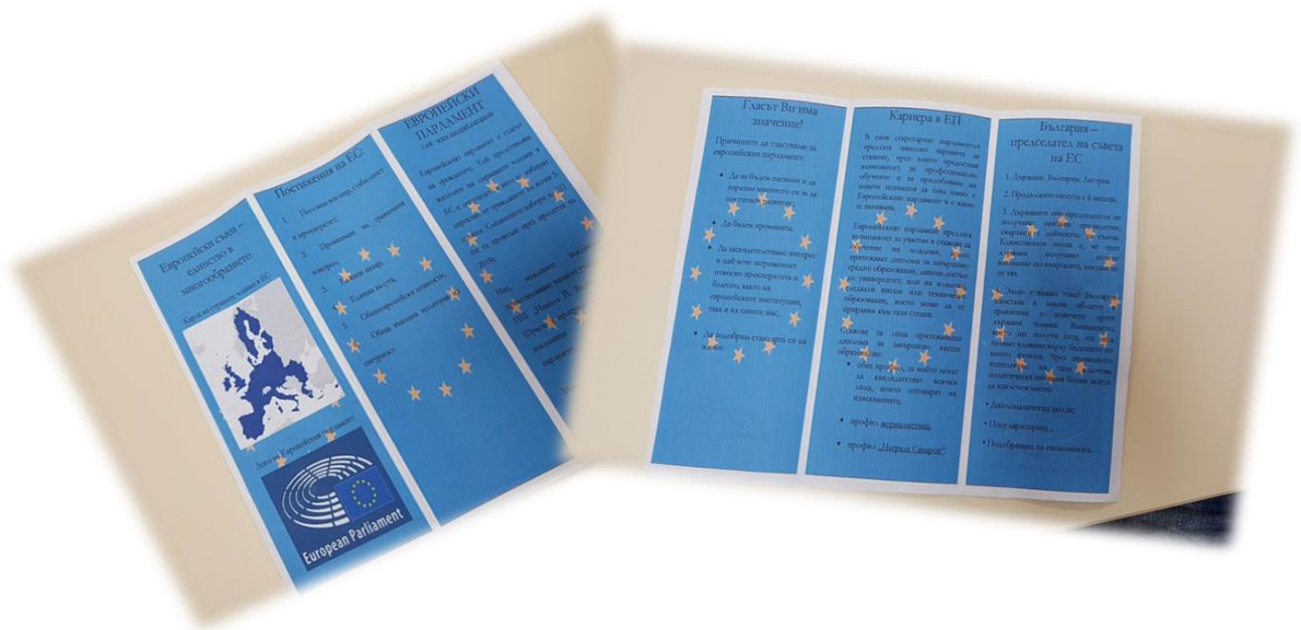
Фигура 6. Информационна брошура за дейността и функциите на Европейския парламент