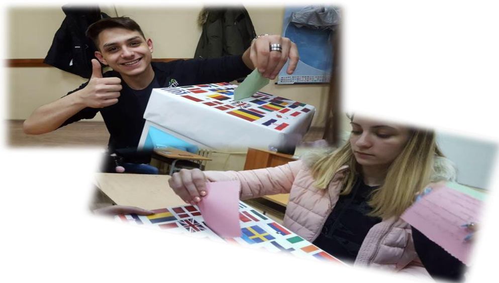
Фигура 7. Провеждане анкета на тема: „Ако аз бях евродепутат“