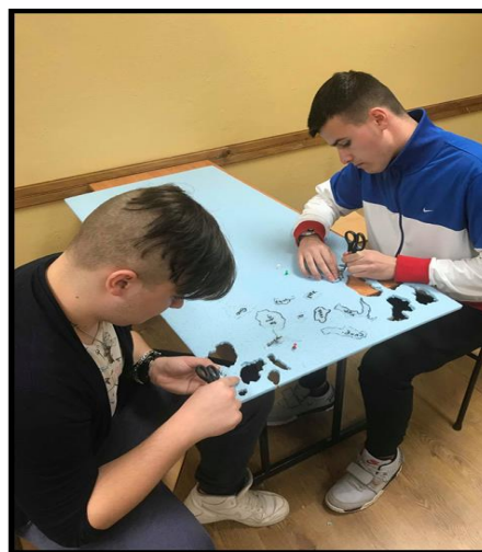
Фигура 4. Създаване на 3D карта на Европейския съюз

- игра – пъзел „Познай държавата и я постави където се намира на картата“ (Фиг. 5);