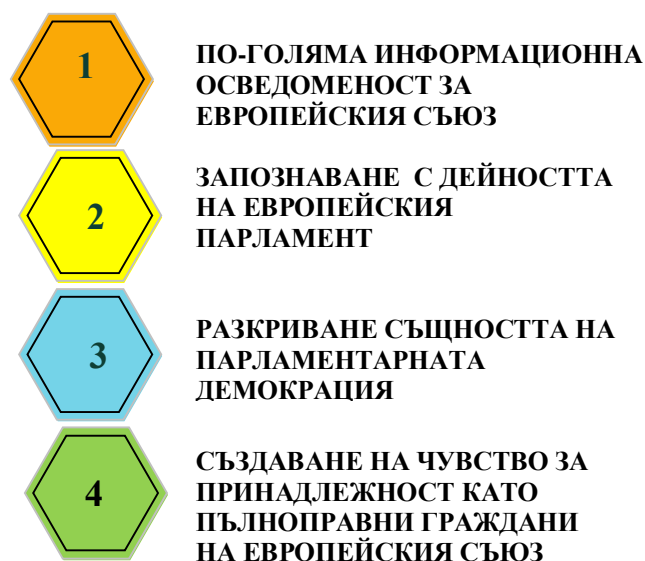
Фигура 2. Цели на програмата за училища посланици на Европейския парламент

Образователната програма „Училища посланици на Европейския парламент“ (Фиг. 1) е насочена към ученици от средни и професионални училища. Основните цели на програмата са посочени на Фиг. 2.